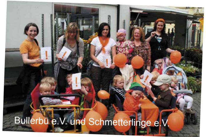
Bullerbü e.V. und Schmetterlinge e.V.