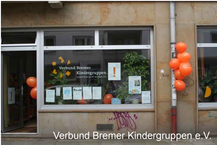
Verbund Bremer Kindergruppen e.V.