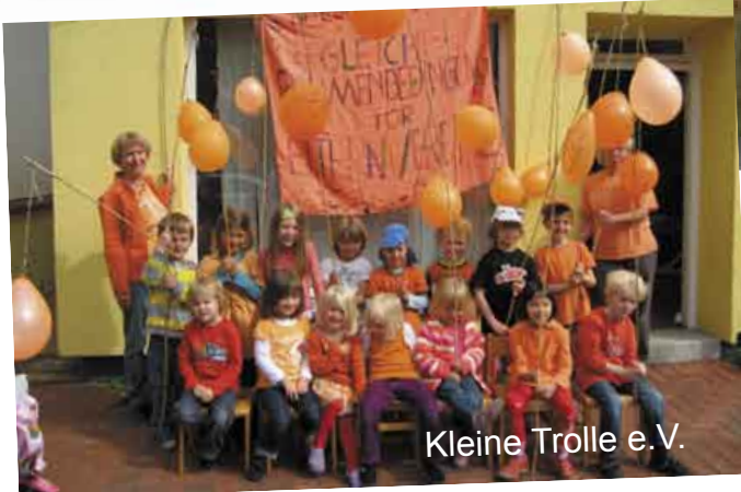
Kleine Trolle e.V.