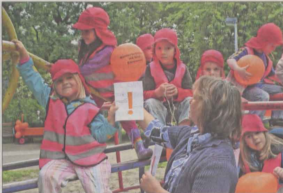
Die Kindergruppe Delmestraße verteilte am Aktionstag Flyer und Luftballons in der Neustadt.

Mitglied in einem Elternverein zu sein, heißt nicht nur, dass das eigene Kind betreut wird. „Wir putzen, kau-