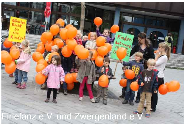
Firlefanz e.V. und Zwergenland e.V.

Wenn Ihr schöne Fotos aufgenommen habt, die wir für unsere Öffentlichkeitsarbeit verwenden dürfen, schickt sie bitte an: kkoecher@verbundbremerkindergruppen.de Vielen herzlichen Dank!!